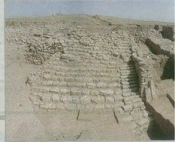
Le rovine del tempio di Kumarbi a Urkesh