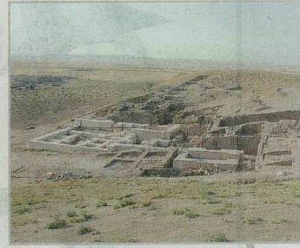
Il palazzo di Tupkish, re di Urkesh